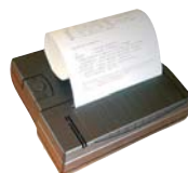
Drucker PCE-BP1 als Zubehör erhältlich