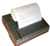
Drucker PCE-BP1 als Zubehör erhältlich