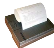
Drucker PCE-BP1 als Zubehör erhältlich

Diese Waagen-Serie bietet die Möglichkeit, die Wägedaten direkt in die Software folgender Logistikpartner einzuspielen. Arbeiten Sie z.B. mit EasyLog von DHL, gelangt das Paketgewicht auf Knopfdruck in die Software. Benötigt wird nur das Datenkabel PCE-PM-RS232.