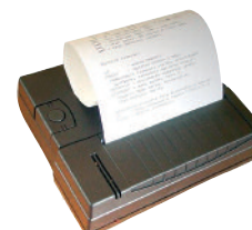
Drucker PCE-BP1 als Zubehör erhältlich

K-CAL-PCE-BT ISO-Kalibrierzertifikat K-PCE-SOFT-BT Software inkl. RS-232 Datenkabel K-RS232-USB Adapter von RS-232- auf USB-Schnittstelle K-PCE-BP1 Thermodrucker inkl. RS-232 Datenkabel K-CW-F2-200 Kalibriergewicht 200 g, Klasse F2, Toleranz ±3,0 mg K-CW-F2-2000 Kalibriergewicht 2000 g, Klasse F2, Toleranz ±30 mg