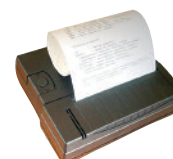
Drucker PCE-BP1 als Zubehör erhältlich