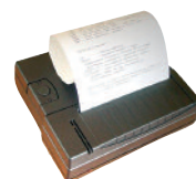
Drucker PCE-BP1 als Zubehör erhältlich