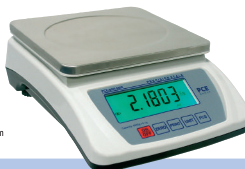
Wägeplatte: 170 x 180 mm