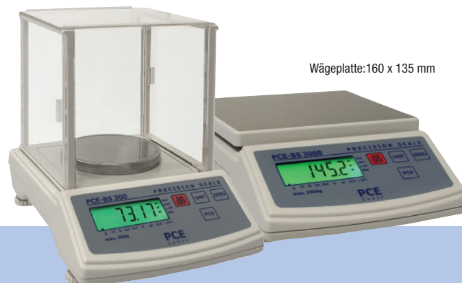
Wägeplatte: 160 x 135 mm