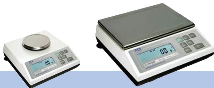
PCE-M 0,3 T mit runder Wägeplatte