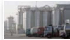
Trockengehaltsprüfung von Slurry