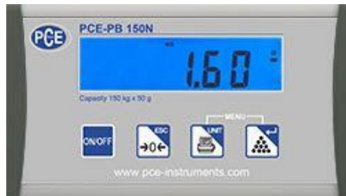
Display der USB Paketwaage PCE-PB N Serie