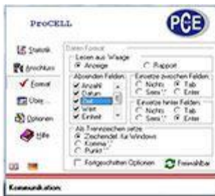
ProCell Software für die USB Paketwaage