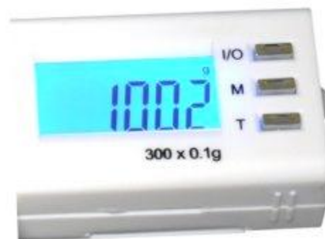
Display der Taschenwaage PCE-JS 300