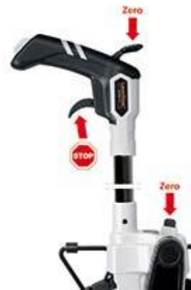
Kurzbeschreibung Streckenmessgerät PCE-MW 1