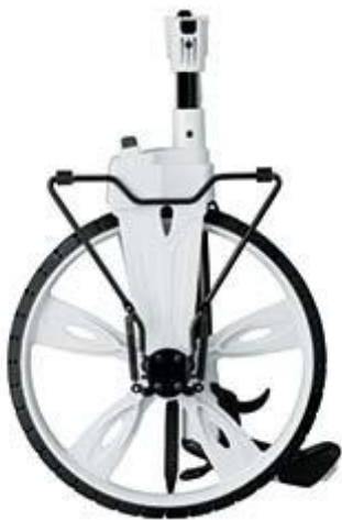
Streckenmessgerät mit einklappbarem Parkständer