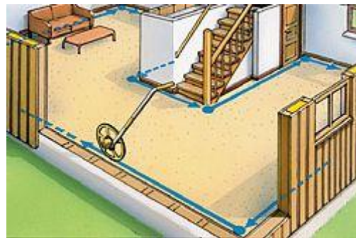
Einsatzmöglichkeit für das Streckenmessgerät PCE-MW 1