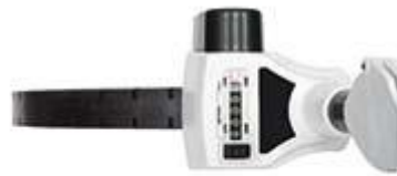
Draufsicht auf das Streckenmessrad PCE-MW 1