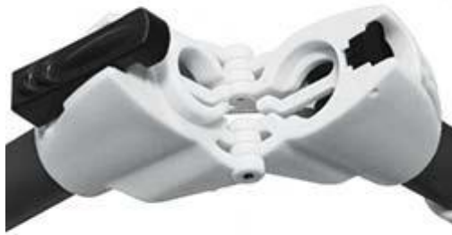
Streckenmessrad mit zusammenklappbaren Handgriff