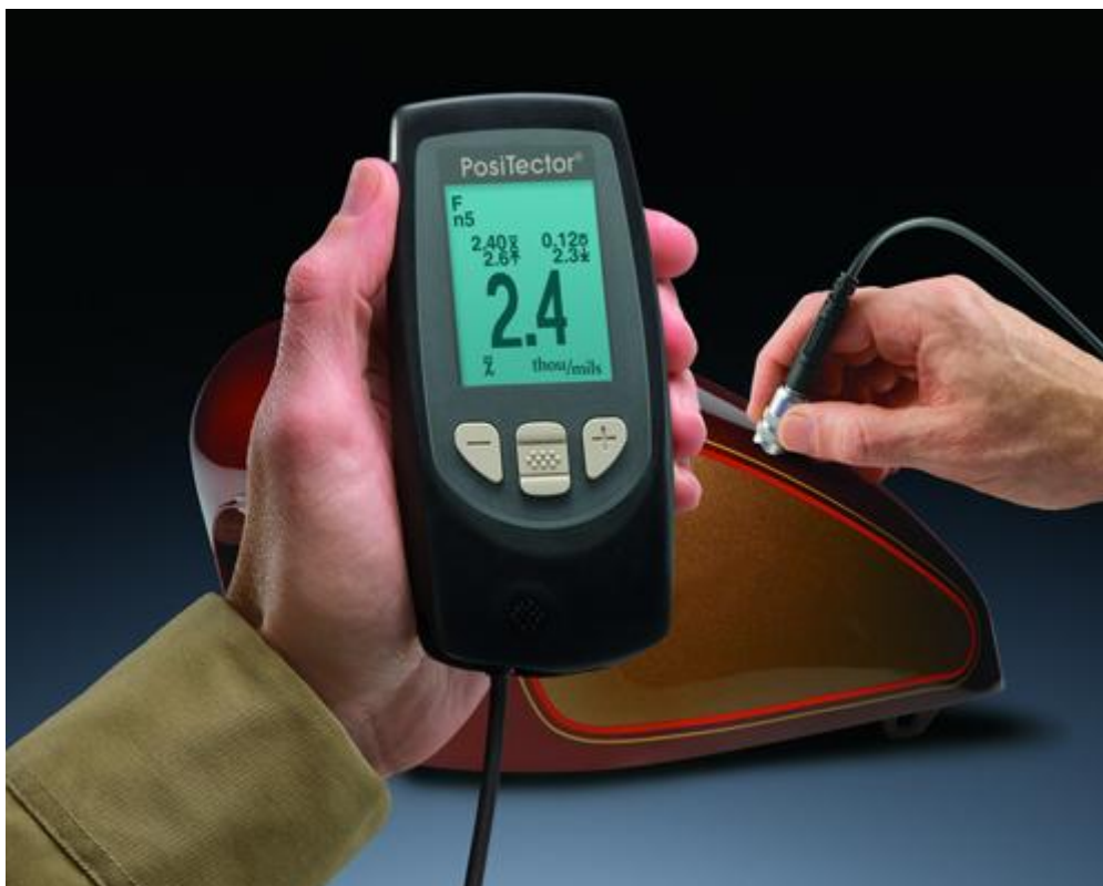
Hier sehen Sie das Schichtdickemessgerät bei einer Schichtdickenkontrolle an einem Motorradtank.