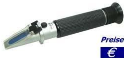
Messgerät für den Lebensmittel-Salzgehalt Refraktometer PCE-028

Anstatt der Refraktometer lässt sich der Salzgehalt von Wasser / wässrigen Lösungen auch mittels digitalen Leitfähigkeitsmessgeräten ermitteln. Besuchen Sie hier bitte auch die Seite unserer elektronischen Leitfähigkeitsmessgeräte .