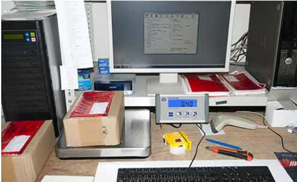
USB Versandwaage PCE-PB N in der Versandabteilung