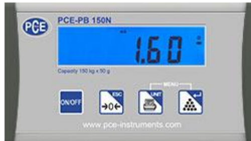
Display der USB Versandwaage PCE-PB N Serie