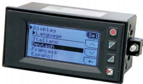
Programmieroberfläche mit Sprachumschaltung

Programmierung: Die Programmierung und Bedienung erfolgt menügeführt über die Fronttasten. Sie erfolgt über Text und ist 5-sprachig umschaltbar. Mit einem Programmierkit kann die Anzeige auch über eine Software programmiert werden. Die Speicherkarte besitzt eine interne Batterie. Dadurch ist eine Programmierung der Geräte ohne Anlegen der Versorgung möglich (bis zu 1.000 Programmierungen mit einer Batterie). Alle Einstellungen sind über ein 4-stelliges Passwort geschützt.