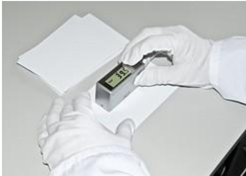
Das Glanzgradmessgerät PCE-GM 60 bei einer Messung auf einer versiegelten Fläche.