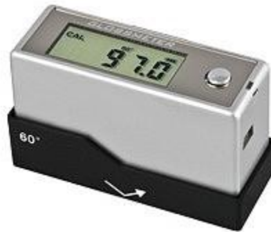
Das Glanzgradmessgerät PCE-GM 60 bei der Kalibrierung auf der Quarz-Kristallplatte.