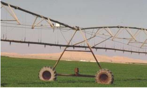
Automatische Bewässerungsanlage in Spanien

Steuerung der Bewässerung von Fußballplätzen, Golfplätzen oder Sportanlagen allgemein.