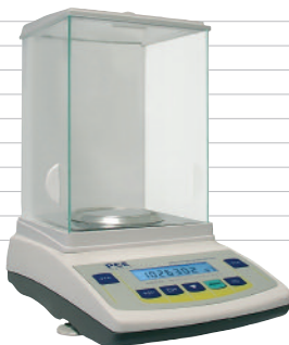
als PCE-AB 100C / PCE-AB 200C auch mit einfachem LCD Display lieferbar