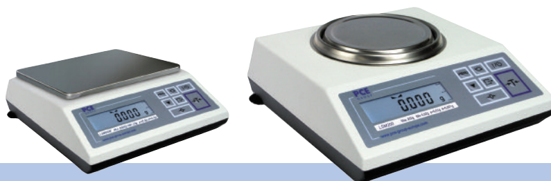
PCE-LSM 6000 Wägeplatte: 225 x 165 mm