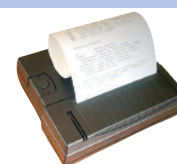
Drucker PCE-BP1 als Zubehör erhältlich