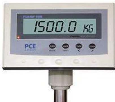
Display der Wiegebalken

Neben der Versorgung mittels dem 230 V - Netzteil kann die Waage über den internem Akku betrieben werden