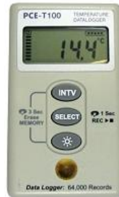
Temperatur-Logger mit Display PCE-T100