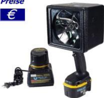
Akkubetriebenes Hand-Stroboskop Beacon

Schalten Sie das Stroboskop ein und lassen Sie sich von der starken Lichtintensität überzeugen. Ein derartig starkes Stroboskop haben Sie noch nicht in der Hand gehabt.