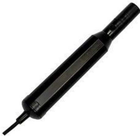
Hier sehen sie die additional erhältliche Sauerstoffsonde zum pH-Meter PCE-PHD 1