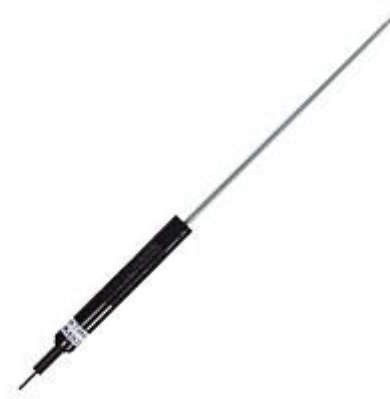
Hier sehen sie den additional erhältlichen Temperaturfühler zum pH-Meter PCE-PHD 1