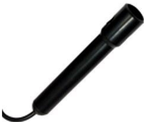
Hier sehen sie die sich im Lieferumfang befindliche Leitfähigkeitselektrode zum pH-Meter PCE-PHD 1