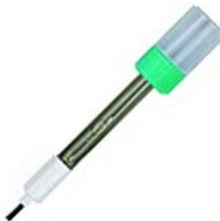
Hier sehen sie die sich im Lieferumfang befindliche pH-Elektrode zum pH-Meter PCE-PHD 1