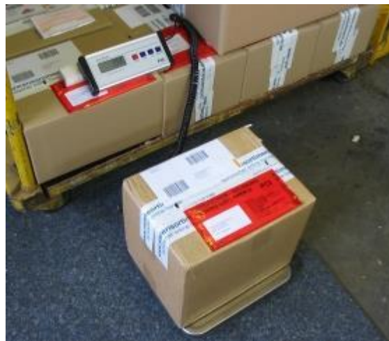
Paketwaage im Einsatz als Versandwaage