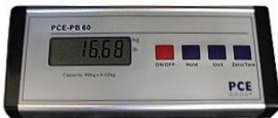
Die Anzeige der Paketwaage PCE-PB

Die Paketwaage kann aber standardmäßig auch statt mittels des 230 V-Adapters mit handelsüblichen Batterien (6 x 1,5 V) betrieben werden. So ist eine hohe Mobilität bei der Verwendung der Paketwaage gewährleistet.