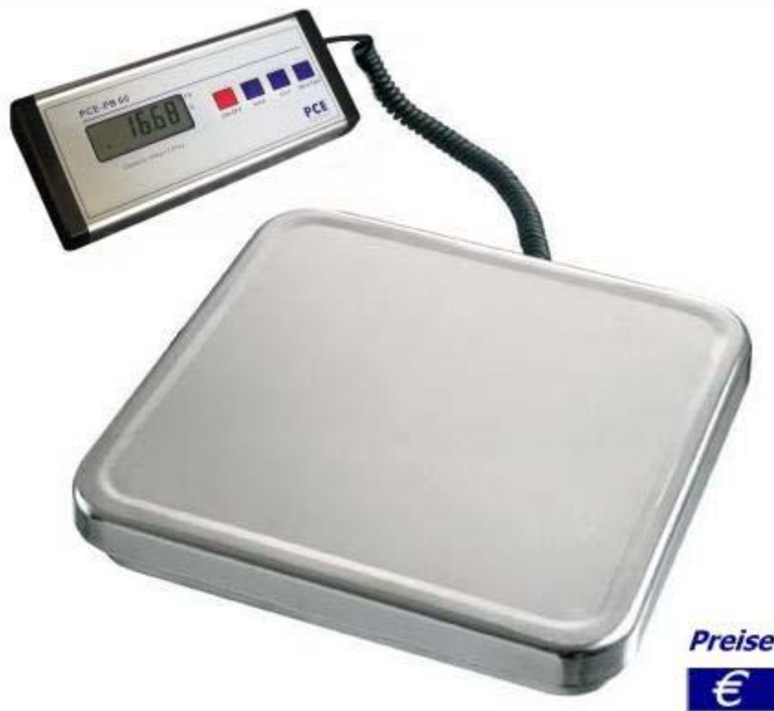
Paketwaage der PCE-PB-Serie

Bei der Paketwaage handelt es sich um eine sehr preiswerte Waage. Diese Paketwaage ist ideal für den Versand, so zum Beispiel die Paketwaage PCE-PB 60, mit einem Wägebereich von 0 ... 60 kg können alle Pakete die versendet werden sollen, kostengünstig und genau gewogen werden. Die Paketwaage wird mit einem 230 V-Steckernetzteil geliefert, kann jedoch auch mit handelsüblichen Mignonzellen betrieben werden. So ist diese Paketwaage auch mobil einsetzbar. Weiterhin verfügt die Paketwaage über eine sogenannte Auto-Power-Off-Funktion. Das heißt, im Batteriebetrieb schaltet diese Paketwaage automatisch nach 3 Minuten ohne Laständerung ab. Das schont die Batterien und gewährleistet einen kontinuierlichen Batteriebetrieb von ca. 60 h. Optional ist ein Software-Kit erhältlich, welches zur direkten Datenübertragung zu einem PC dient. So können die Wägedaten später weiterverarbeitet oder analysiert werden. Hier sehen Sie eine Gesamtübersicht aller Waagen der PCE Instruments.