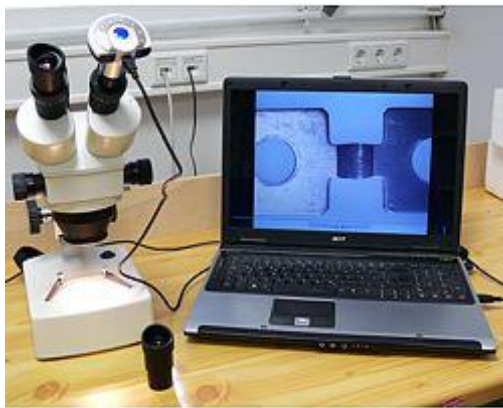
Hier sehen sie das Micro-Okular bei der Untersuchung einer Klemmfeder