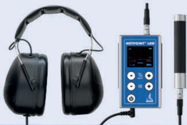
Produktbeispiele aus dem Lieferumfang. Nicht Typverbindlich.

Da lediglich die Frequenzen erfasst werden, die im Fall einer Leckage auftreten, ist die präzise Ortung der Leckage auch bei jeder Art von Arbeitslärm sichergestellt.