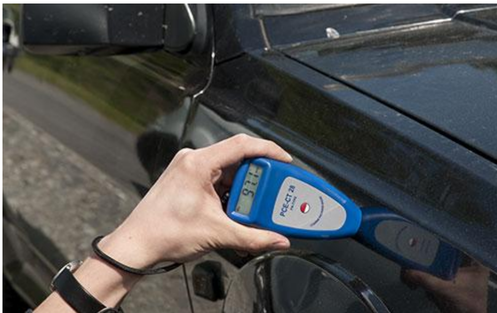
Dickenmessgerät im Einsatz an einem KFZ.