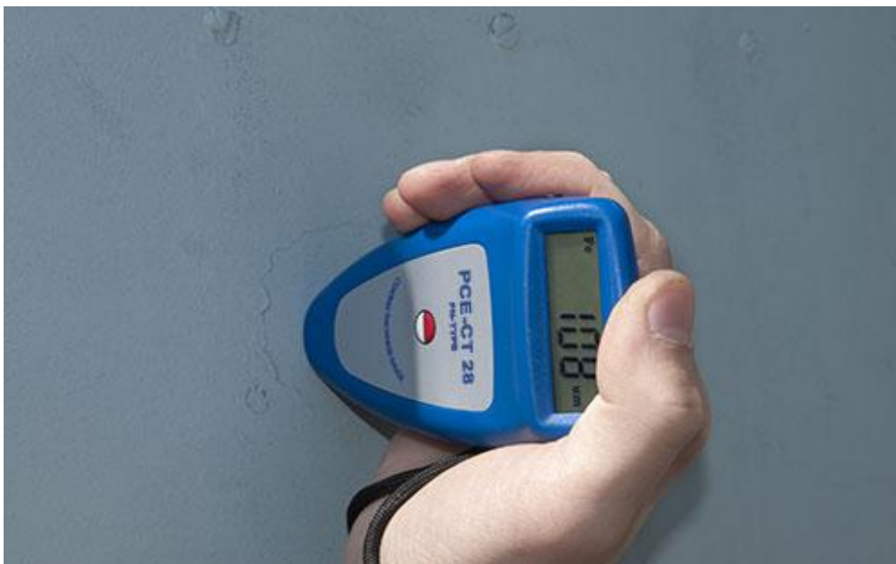
Hier sehen sie das Dickenmessgerät PCE-CT 28 bei einer Farbdickenmessung.