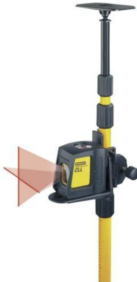
Kreuzlaser ST-CLL inkl. Teleskopstange (ausziehbar bis 3 m) und Multifunktionshalterung geliefert