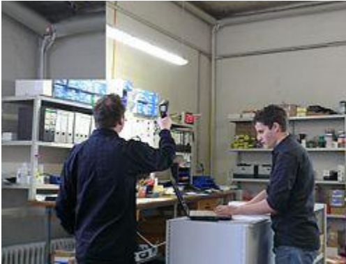
Das Infrarotthermometer bei der Temperaturmessung und gleichzeitiger Analyse über die Software