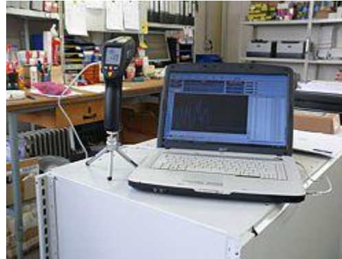
Das Kreuzlaser-Infrarotthermometer im direkten Anschluss an die Software mit Grafischer und tabellarischer Auswertung