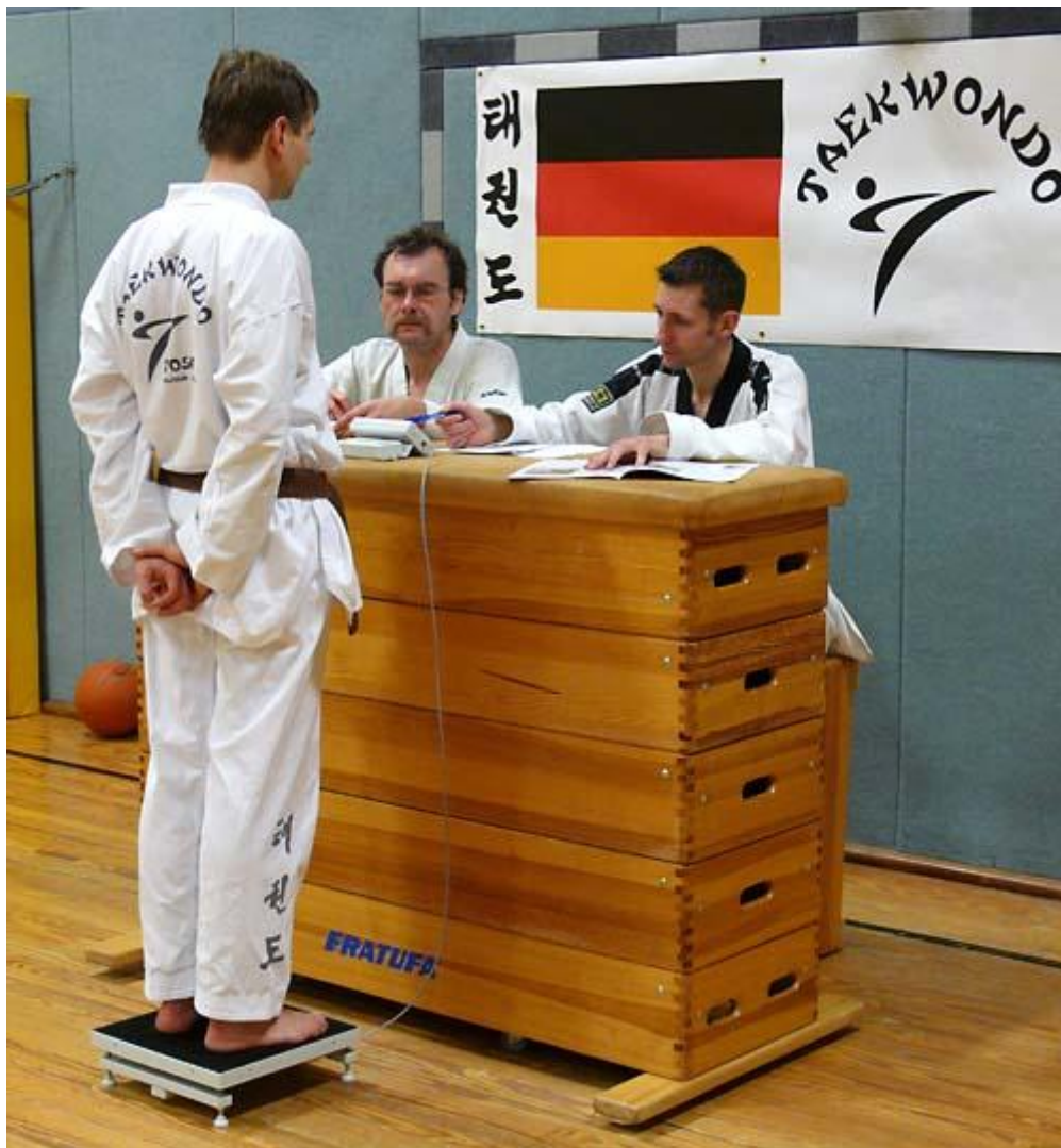
Hier sehen Sie die Sportwaage PCE-PS 200MPC im Einsatz bei der Überprüfung der Einhaltung der Gewichtsklassen bei Taekwondo-Wettkämpfen