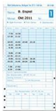
Die oben abgebildete Stempelkarte ist für die elektronische Stempeluhr erhältlich.