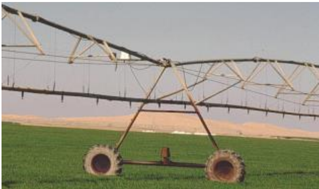
Automatische Bewässerungsanlage in Spanien

Typisch wird dieser Boden-Feuchtemesser im landwirtschaftlichen Produktionsbereich eingesetzt. Vermehrt aber auch zur Optimierung der Pflanzenzucht in Gewächshäusern oder zur besseren Planung / Steuerung der Bewässerung von Fußballplätzen, Golfplätzen oder Sportanlagen allgemein.